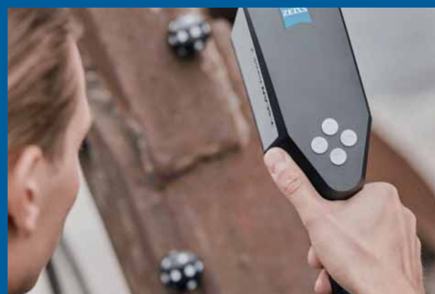
測定ワークフロー全体をボタン1つで