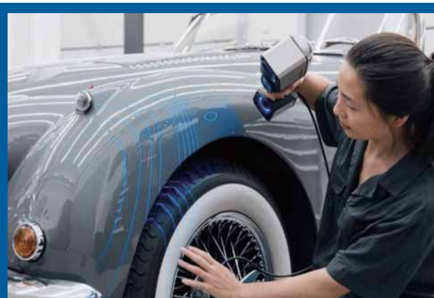
光沢面や黒物も難なく測定