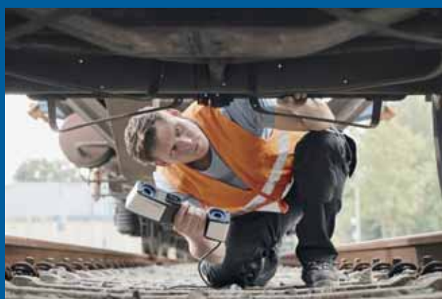
測定の可能性を広げる多彩なスキャンモード