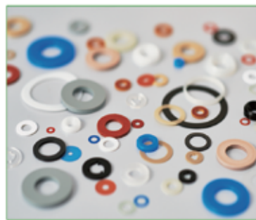
(金属・樹脂・ゴムワッシャー)