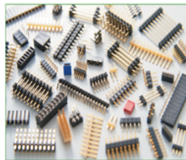
(ピンヘッダー・ソケット)