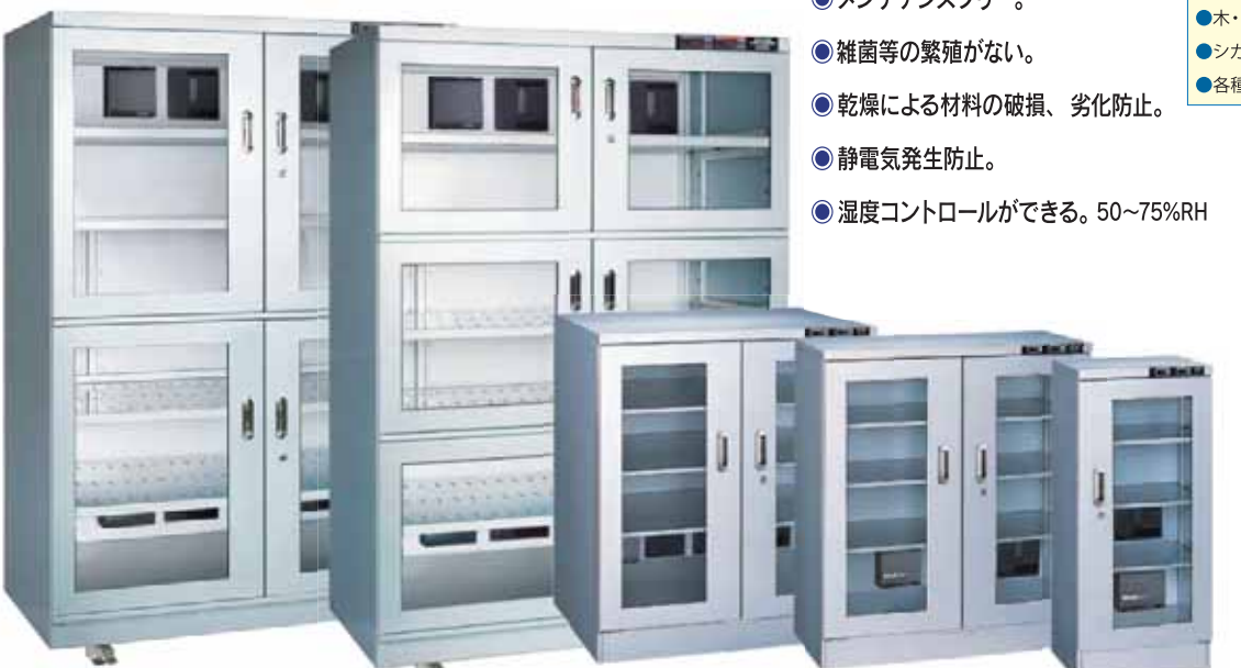
WET-1432-AHU (1260ℓ) WET-1332-AHU (1260ℓ) WET-510-AHU (485ℓ) WET-300-AHU (291ℓ) WET-160-AHU (145ℓ)

◎スチールブラックシリーズ◎ WET-112, WET-182, WET-322 もあります。