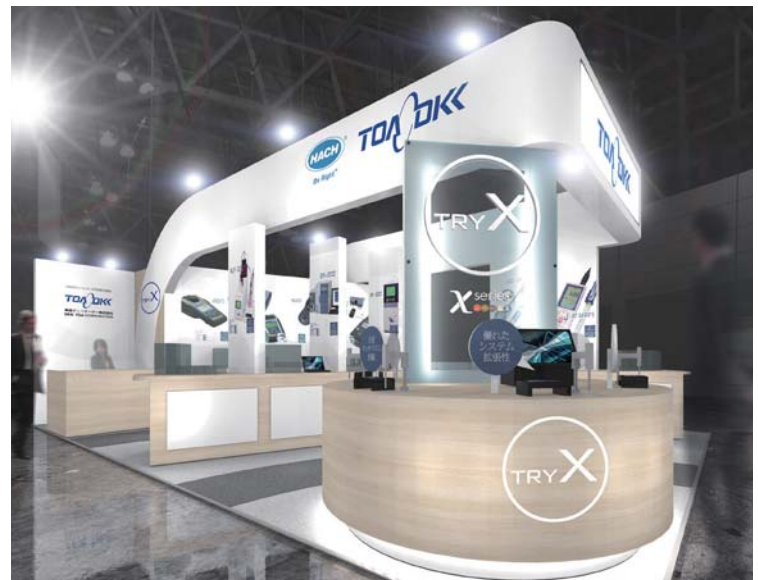
ブースはイメージ図です。